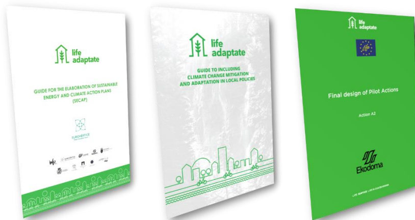
Materiales del proyecto LIFE Adaptate objeto de difusión